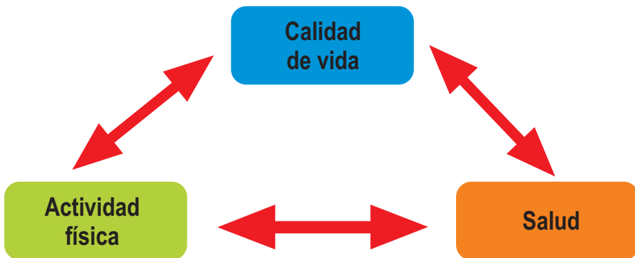
Figura 1. Relación calidad de vida, actividad física y salud

La figura 1 muestra la relación que existe sobre la calidad de vida, la cual a partir de sus dimensiones maneja el estado físico como aspecto primordial para mantener la salud y, a partir de ello, se enuncia que la cultura física busca colaborar en el proceso optimizador de la persona, por tanto intentará aportar beneficios para la salud.