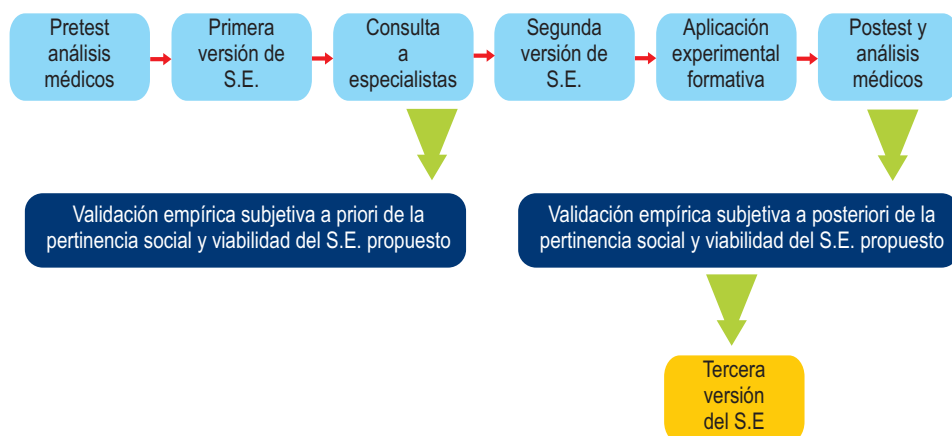
Figura 2. Proceso realizado

La población universo de la investigación fue de 70 alumnos y fue de carácter intencional. En la figura 2 se presenta el proceso realizado. A continuación se presentan los resultados de correlación del pretest y posttest.