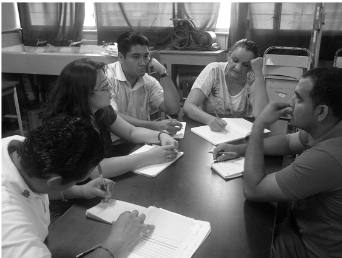
Figura 4: Docentes de la Facultad de Educación e Idiomas practicando metodologías participativas