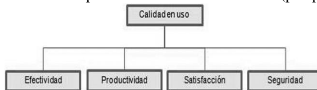
Figura No. 3: Modelo para evaluar la calidad de uso (perspectiva de usuarios).

En modelos como la ISO 9126 se enfatiza realizar dichas evaluaciones, para lo que proponen modelos como el modelo de evaluación de calidad externa-interna (ver fig. No. 2), y un modelo de evaluación de calidad de uso (ver fig. No. 3), (MORENO et al. 2010).