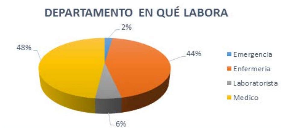
Figura 2. Departamento en que labora el personal encuestado.

Entre la población encuestada se encontró que el 33 % tenía entre 41 y 45 años; 22 % de 46 a 50 años; 18 % de 36 a 40 años; 12% mayor de 51 años; 11 % menor de 30 años, mientras que