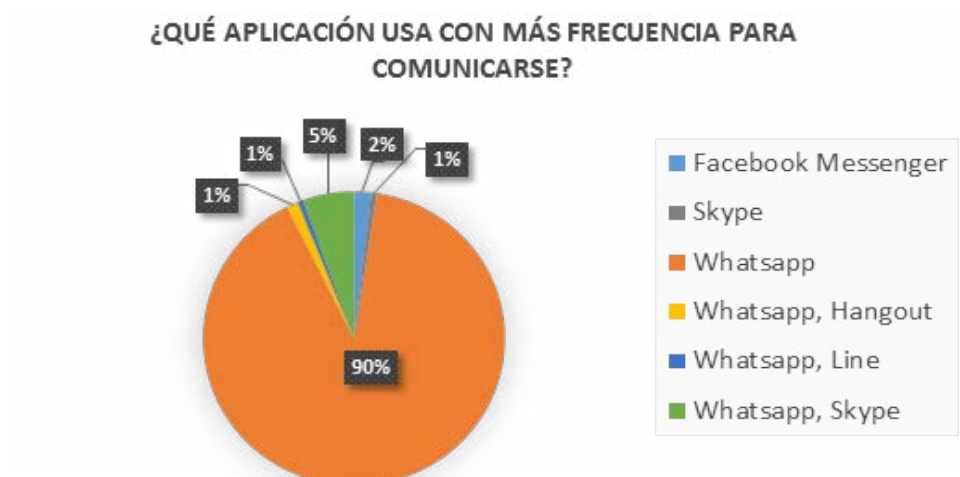
Figura 5. Aplicación usa con más frecuencia para comunicarse.